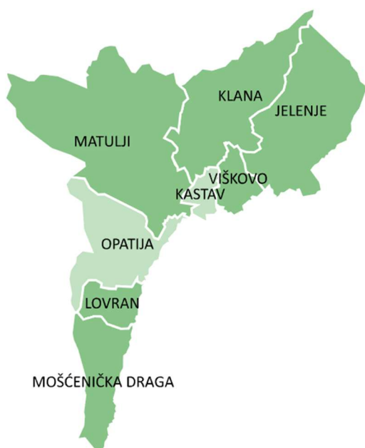
Slika 2: Karta položaja LAG-a na karti Republike Hrvatske

*karta LAG-a dostupna je i u Prilogu 1. LRS